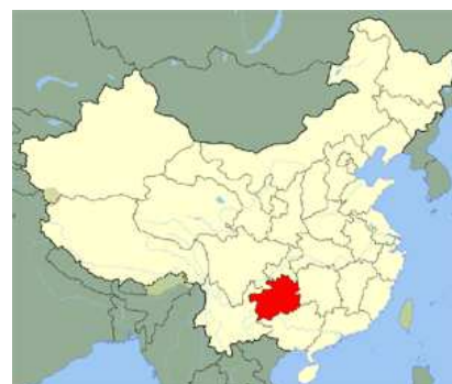
(中国「貴州省」の位置)

省の広域には古生代の石灰岩が分布して、中国有数のカルスト地帯(中国南方カルスト)となっており、一部は世界遺産に登録されています。大きな平地がないことから、「地に三里の平地無し」と言われ、全域が亜熱帯高原であるため、極端な暑さ寒さはないものの、降水量は多く、晴天の日が少ないことから、「天に三日の晴れ無し」。僻遠のこの地は、昔は貧しかったゆえに「人に三銭の金無し」。すばらしい自然に恵まれ、近代化進展の中での心暖かな人達の地です。