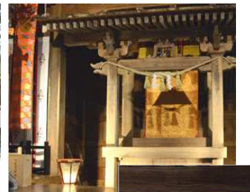
御開帳の早朝に、拝殿と本殿鞘堂板戸を開放。