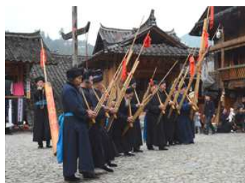
広場の中央での蘆笙。重低音の大笙から、旋律演奏の小型まで。昔が想われる懐かしいメロディの。