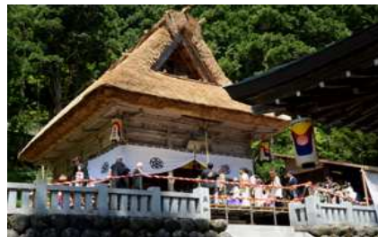
上梨地区の人達が、正装で、次々に御開帳を拝観。右仮設では宝物展示。