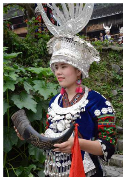
村へ入る前のお酒でのお出迎え

次回(第66回)は 6月13日(予定)に、真木太一様(九州大学名誉教授)による「75歳・心臓身障者の日本百名山・百高山単独行」