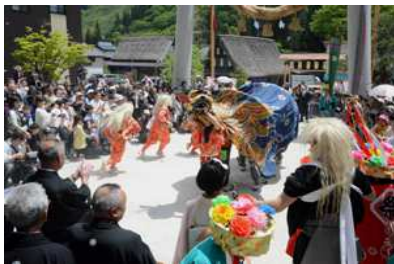
御開帳が始まって、五箇山各聚落からの獅子舞が次々に奉納される。