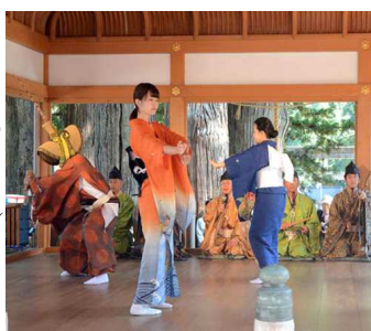
当日昼の奉納踊りと、