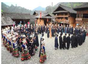
蘆笙を囲み、総出での旋廻。