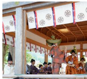
拝殿では、子供達による「こきりこ踊り」を奉納。