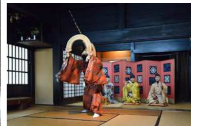
国重文「合掌造り/村上家」での「こきりこ踊り」(ご開帳とは別機会)(この踊りと衣裳の復元は昭和26年)

ご開帳については、養老元年の泰澄による創祀と伝わる平泉寺白山神社でも33年ごとに行われてきており、次回は2025年です。一方では、若き日の泰澄が遙かに白山を望んで登峰・開山を志したと伝わる越知山大谷寺(福井県越前町大谷寺)でも、15年前後の間隔をおいてのご開帳が行われて来ています(前回は昨年11月2-4日)。