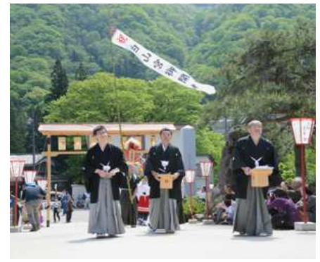
五箇山各聚落からの祝賀・ご祝儀の人達

(内容は、昨年11月の「日本山岳文化学会 17回大会」での一般講演に、紹介写真を更に増補したものです。)