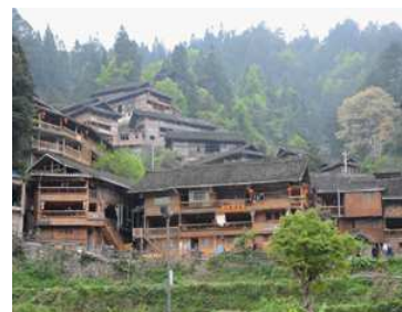
少数民族「苗(ミャオ)族」の一聚落。下写真の「黔东南苗族侗族自治州雷山县郎德苗寨」で。

貴州省の人口は約3580万人で、漢族が63%(約2200万人)。少数民族で多いのは苗(ミャオ)族397万人で、以下、布依(ブイ)族251万人、土家(トゥチャ)族144万人、侗(ト)族143万人と続きます。省面積の1/2以上が少数民族の自治区域となっています。これらの民俗は、近年、観光資源化されています。[統計データは中文版Wikipediaより]今回は、これらのうちの幾つかの民族の人たちと、その生活を紹介します。なお、民族が同じでも、その聚落(寨；村)が違えば、人々の装いなどは違うのが普通です。下は、苗族の「郎德」村を訪れた際の写真です。