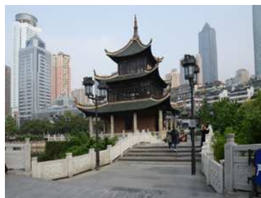
貴州省の省都・貴陽市には、明の萬曆帝の時代に、「科挙」合格者が出ることを祈念した高秀楼が現存。