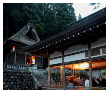
昔からと同様に、夜の訪れと共に始まる五箇山白山宮の秋祭り