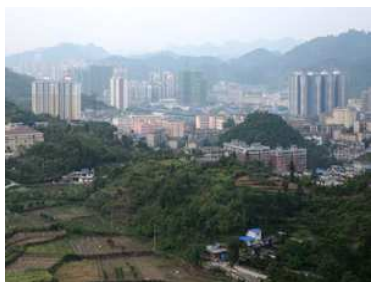
市街地から離れた農山村にも、突然に高層ビル群が出現。