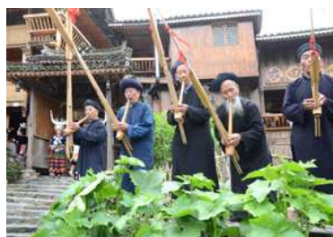
村の入り口で、歓迎の蘆笙演奏。(貴州省の「郎德苗寨」で。)

貴州省の人口は約3580万人で、漢族が63%(約2200万人)。少数民族で多いのは苗(ミャオ)族397万人で、以下、布依(ブイ)族251万人、土家(トゥチャ)族144万人、侗(ト)族143万人と続きます。省面積の1/2以上が少数民族の自治区域となっています。これらの民俗は、近年、観光資源化されています。[統計データは中文版Wikipediaより]今回は、これらのうちの幾つかの民族の人たちと、その生活を紹介します。なお、民族が同じでも、その聚落(寨；村)が違えば、人々の装いなどは違うのが普通です。下は、苗族の「郎德」村を訪れた際の写真です。