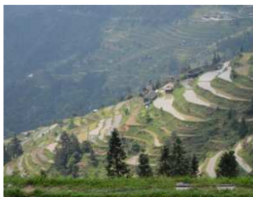
山間部が多く、農耕地の殆どは見事に作られた棚田。(日本でも、むかし、よく見た風景。)