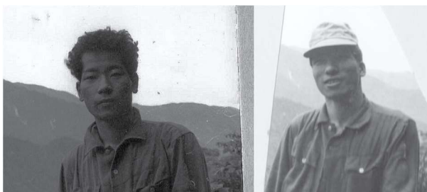
1965年7月(43年前)北ア 抜戸平偵察の二

40年前と同じ顔の代表格はこの二人。40年前に成長が止まったのか。あるいは昔から成長しきっていたのか。これから20年後も同じであれ!