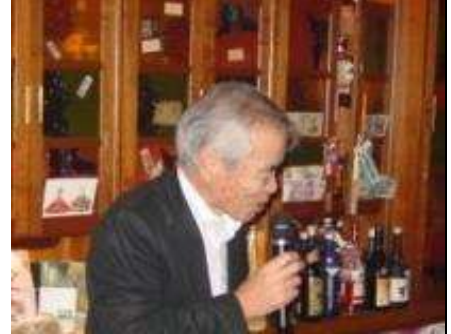
俊成さん いつもお世話になっています。今回もスタンドの中からみんなに大サービス。