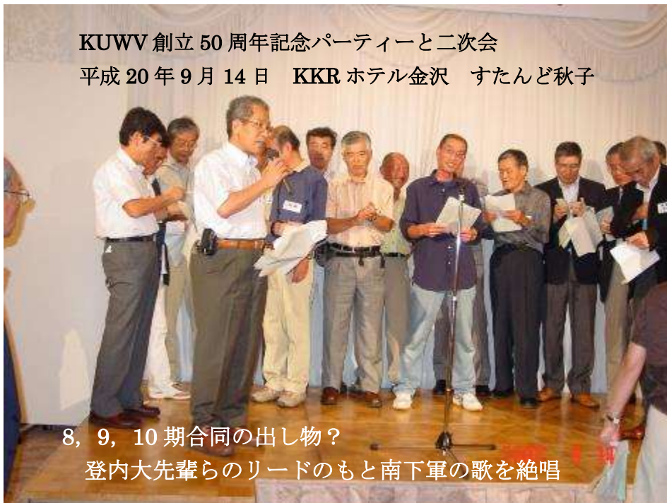
8, 9, 10 期合同の出し物? 登内大先輩らのリードのもと南下軍の歌を絶唱