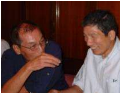
伊豫さん 情熱も体つきも、41年前と同じだ。おつむを除けば。44年前の歓迎PW、冬の大門の話に熱弁だ。