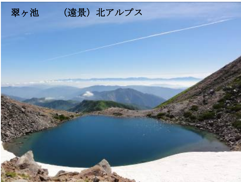
翠ヶ池 (遠景) 北アルプス