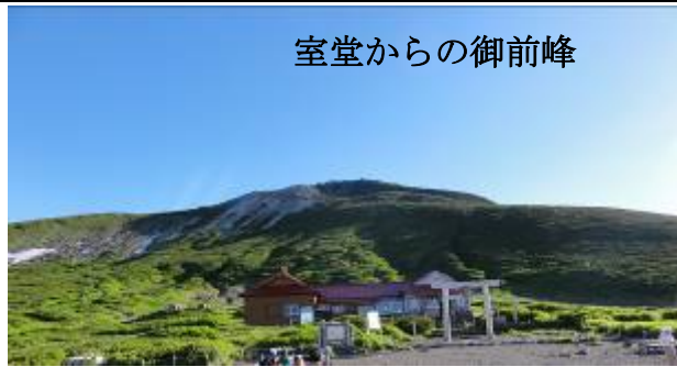
室堂からの御前峰