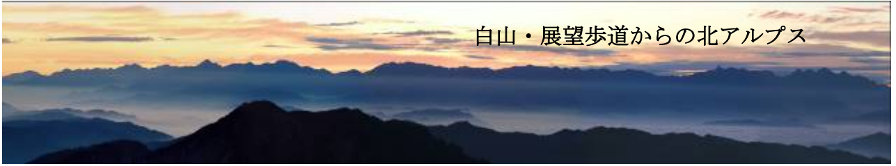
白山・展望歩道からの北アルプス