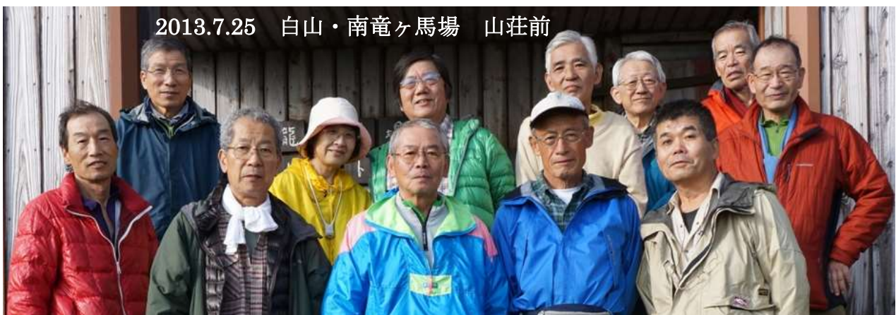
2013.7.25 白山・南竜ヶ馬場 山荘前