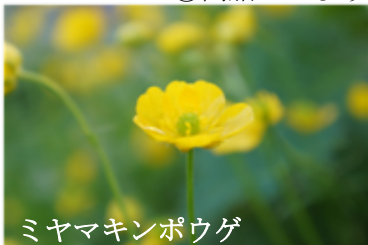
ミヤマキンポウゲ

筆者追記…久保田競（京大名誉教授）曰『週1回3時間の山登りを3カ月続けると前頭前野の容量が増し、賢くなる。学校の成績向上も期待できる』