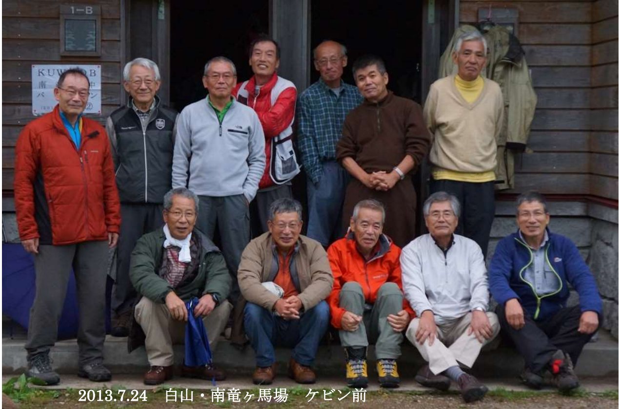
2013.7.24 白山・南竜ヶ馬場 ケビン前