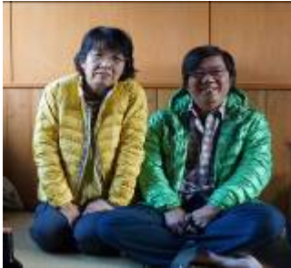
25日に合流した山西夫妻