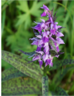
ウズラバハクサンチドリ

ところで、皆さん『ウズラバハクサンチドリ』はどんな花か覚えていますか。次の白山登山までは、覚えておいてね、またその漢字名も覚えてね。