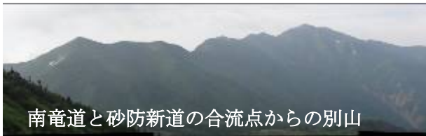
南竜道と砂防新道の合流点からの別山