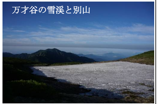
万才谷の雪溪と別山