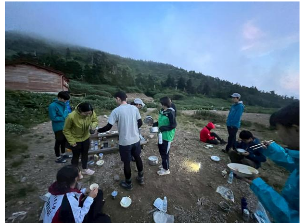
南竜ヶ馬場野営場での夕食(2025/08/26)

特に印象に残ったのは夕食に作ったカレーです。15 人分のカレーを一斉に作って皆で食べたのはとても楽しかったです。お肉などに関しても冷凍して持っていくことで山でも普段と変わらない物を使えるのも分かりました。二日目は朝から雨が降り雷雲も接近していましたが登頂を断念せざるを得ない結果になりましたが、宿泊経験はとても良い経験になりました。